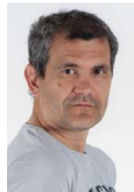
Edu A. Martín Vs. de Seguridad Vial

La remodelación de la carretera C-245 a su paso por Viladecans, pese a que el gobierno socialista dice que es "la mejora de la carretera", es realmente una chapuza. Los conductores se ven obligados a ir serpenteando no sabiendo en muchos de los giros cuál es su carril; los peatones con una montaña rusa de barreras arquitectónicas y sin saber por dónde les va a atacar la bicicleta o el patinete; los semáforos totalmente descoordinados y en un número ingente; atascos innecesarios, cuando el gobierno socialista habla de eliminar la huella de carbono; y un largo etc, que posiblemente ya conocen de sobra y sufren de forma innecesaria.