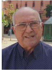
Custodio Jiménez Vs. de Personas Mayores

El PP de Viladecans considera que la labor de las personas mayores, a través de las entidades, es primordial para combatir la soledad y socializar.