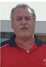
Vicente Sanchís Vs. de Agricultura

Un IPC que sitúan entre el 10 y 6% pero que realmente supera el 60% nos hace cada día más pobres. Incluso a los pensionistas, que con una subida de las pensiones del 8,5% tienen que ayudar a sus hijos y pierden más del 50% de capacidad de compra. Que no nos engañen más.