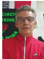
Carlos Moya Vs. de Deportes

El PP de Viladecans hará que en Viladecans la juventud y todas las personas que lo necesiten puedan acceder a una vivienda social y paguen aquello que realmente pueden.