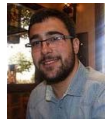
Juan Gadeo Vs. de Educación

Des de 2008 els alumnes fan servir les aules prefabricades, o barracons, a l'espera del l'edifici que allotgi als alumnes i doni resposta a la creixent demanda de places. Una vergonya. El PP de Viladecans, si governa després de maig de 2023, farà possible la construcció de l'institut escola dignificant les dependències del centre Mediterrània.