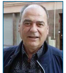
José Aranda Vs. de Infraestructuras

Los vecinos de los diferentes barrios de Viladecans consideran que el Ayuntamiento los tiene dejados de la mano de Dios, ya que la vía pública presenta una gran dejadez.